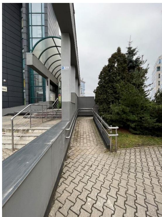
Schody wejściowe - podjazd – wejście główne do MOPS we Wrocławiu (2)