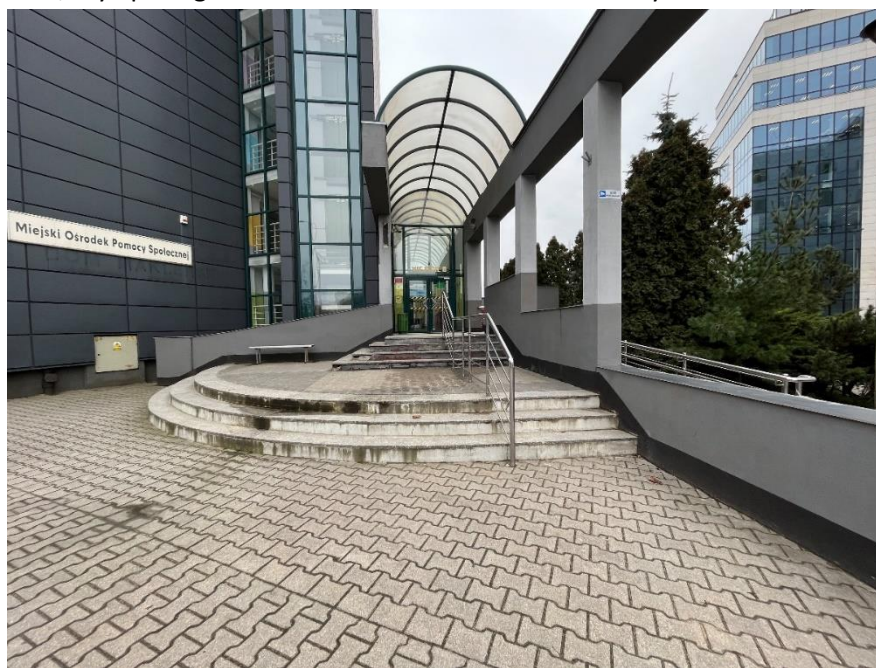
Schody wejściowe – wejście główne do MOPS we Wrocławiu (1)

Obszar wejścia do budynku stanowi główny ciąg komunikacyjny do budynku i drogę przeciwpożarową, dlatego prace utrudniające bezpośrednią komunikację winny być prowadzone poza godzinami działania MOPS, czyli poza godzinami od 6 do 16 w dniach roboczych.